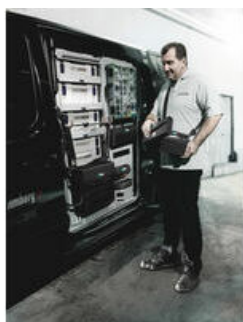
Wera 2go 1 - de pakezel