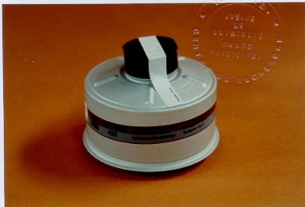
Photographie de l'équipement

référence 1730140 (identification en Allemand, Italien et Espagnol)