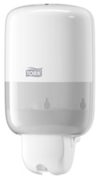
Tork Mini Liquid Soap Dispenser White 561000