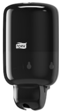
Tork Mini Liquid Soap Dispenser Black 561008