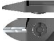
O / Ovaal