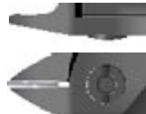
T&R / Spits aflopend