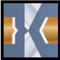
F / Flush