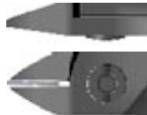
T / Spits