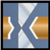
MB / Micro-Bevel