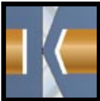
UF / Ultra-Flush®