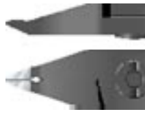
A / Hoek