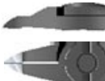
TP / Tip