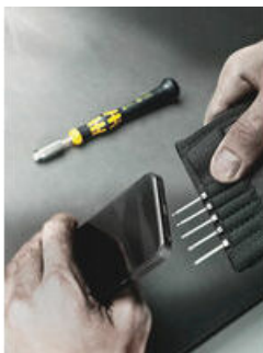
In handig vouwetui