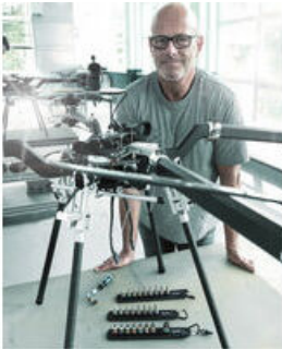
De Wera belts