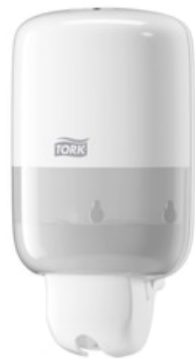
Tork Mini Liquid Soap Dispenser White 561000