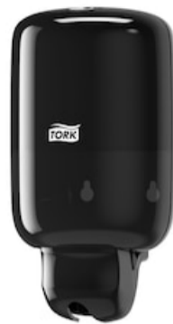
Tork Mini Liquid Soap Dispenser Black 561008