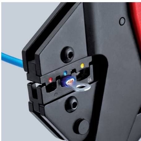
97 43 200 avec matrice de sertissage 97 49 06 pour cosses isolées, connecteurs et manchons