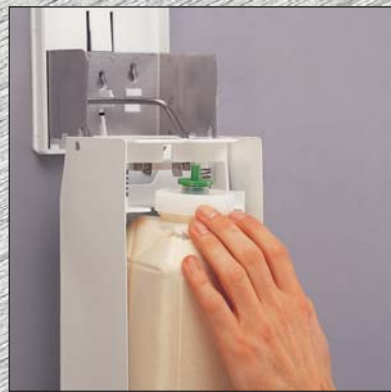
Insérer la recharge par le haut