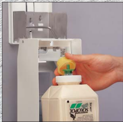
Enlever le bouchon de la recharge