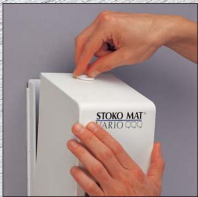
Ouvrir le distributeur