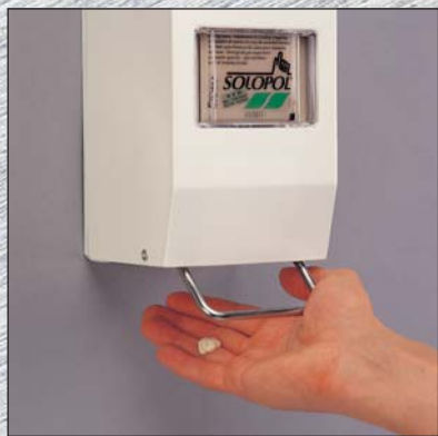
Le distributeur est prêt à l'emploi