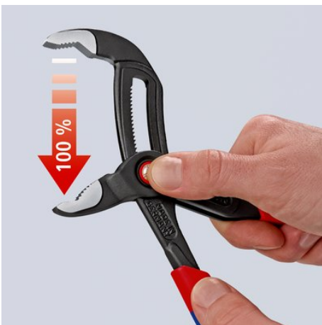
Appuyer sur le bouton – ouvrir intégralement la pince